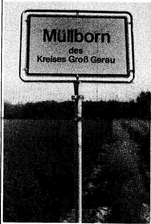
Das weite Land mit dem Namen "Auf der Hardt" - zwischen Büttelborn, Weiterstadt, der Bundesstraße 42 und der Autobahn gelegen - soll weit über das Jahr 2000 zum "geeigneten Standort" von Mülldeponien gemacht werden. Rechtlicher Widerstand ist dringend nötig.

besagten Gelände. "Wegen der unvermeidlich auftretenden Setzungen und gründungstechnischen Schwierigkeiten" lehnten sie eine Überbauung der Altlast ab. Ein weiteres in diesem Zusammenhang wichtiges Kriterium war für das Ingenieurbüro die Lage des Geländes im Einzugsbereich der Trinkwasserbrunnen des Wasserwerks in Dornheim, was besonders bei Ribildung der Deponieabdichtung Folgen haben könnte.