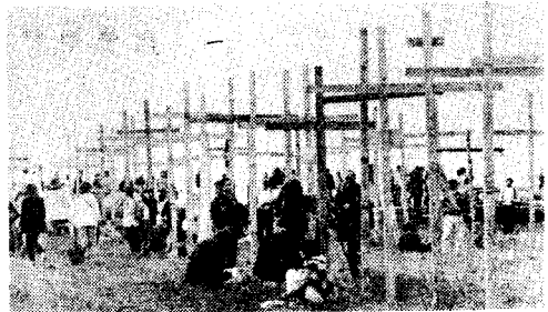
Friedensdemonstration gegen die Cruise-Missile-Stationierung im Hunsrück