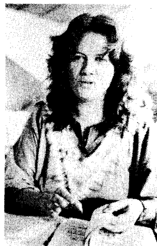
Grünen-Sprecherin Jutta Dittfurth

Wir sind die Partei, in der die Frauen nicht nur die Hälfte der Mandate innehaben, sondern in der die Frauen auch nicht mehr verfügbar sind, weder für die Gewalt von Männern noch für die Urteilsprüche von Kardinälen. Wir wissen, daß von unserer Kraft, unserer Frechheit und Listigkeit auch die Frauen der anderen Parteien und in anderen gesellschaftlichen Organisationen profitieren – und das ist uns gerade recht.