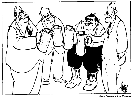
... auf unsere großzügigen Spender! Neue Osnabrücker Zeitung

Immer wieder gab es in der Geschichte der Bundesrepublik, in der Anti-Atom-Bewegung der fünfziger Jahre, in der Studentenbewegung der sechziger Jahre, in den neuen sozialen Bewegungen der siebziger Jahre, diesen Willen nach einer grundlegenden Demokratisierung der bundesrepublikanischen Verhältnisse. Dagegen fanden sich immer genug, die aus Mißtrauen gegen die Bevölkerung die Macht lieber in den Händen der Eliten des Parteienstaates lassen wollten.