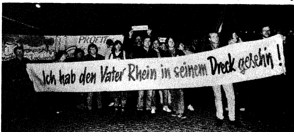
Protestdemonstration gegen Rhein-Verseuchung

Deswegen müssen Ökologen auch immer demokratische Rebellen sein,