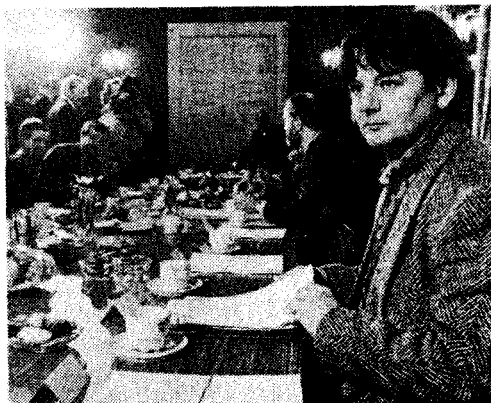
Kabinettsmitglied Fischer: „So viel hab' ich noch nie geackert“

dem meinen wir: Wenn die SPD heute ernsthaft aus dieser Politik einen Ausstieg sucht, wird es an unserer Bereitschaft zur Zusammenarbeit nicht fehlen – weil sie notwendig ist.