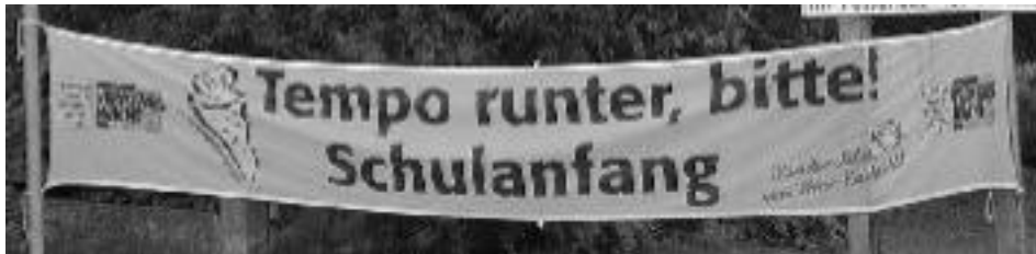
Tempo runter - Ja, aber bitte ganzjährig!

Die Grüne Liste Büttelborn wird über die Gemeindevertretung aktiv werden und die flächendeckende Ausweisung von Tempo-30-Zonen in Wohngebieten beantragen. Wir setzen auf die Unterstützung der anderen Fraktionen und einen einstimmigen Beschluss, die Erhöhung der Sicherheit im Straßenverkehr, insbesondere für Kinder und ältere Menschen, sollten allen Kommunalpolitikern am Herzen liegen.